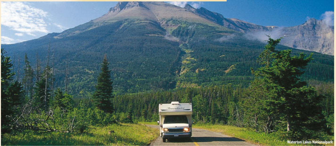
Waterton Lakes Nationalpark