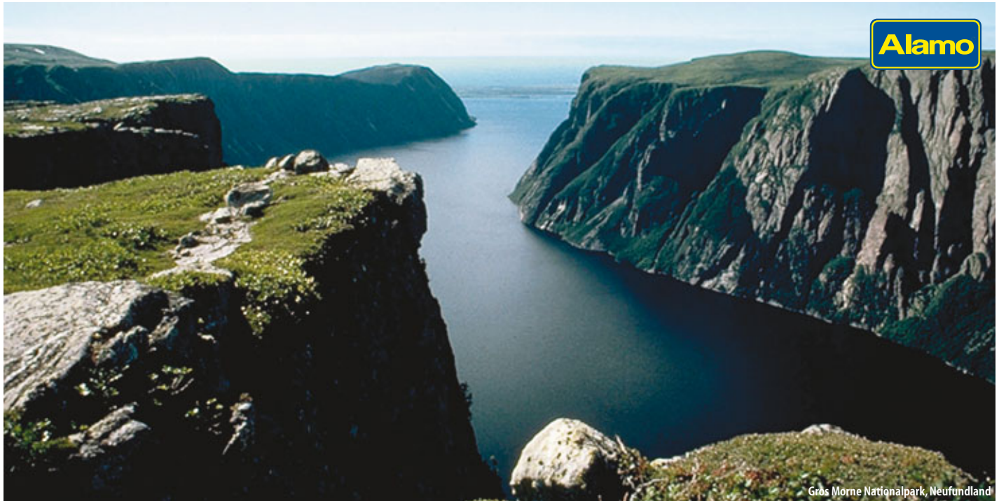
Gros Morne Nationalpark, Neufundland

Nova Scotia und Neufundland – lassen Sie sich von malerischen Fischerdörfern, der rauen Landschaft und der weiten, unberührten Natur verzaubern. Lernen Sie das ureigene Lebensgefühl dieser kanadischen Provinzen schätzen, entweder als 15-tägige Variante in Nova Scotia oder mit einem zusätzlichen Abstecher nach Neufundland (22-tägig).