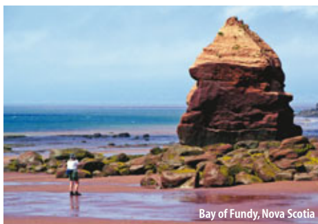
Bay of Fundy, Nova Scotia