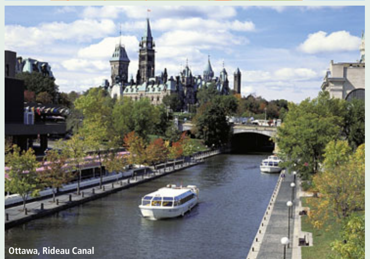
Ottawa, Rideau Canal