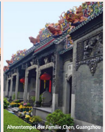
Ahnentempel der Familie Chen, Guangzhou

9. Tag (Di): Shanghai – Hangzhou Bevor Sie das quirlige Shanghai verlassen, besichtigen Sie den Jadebuddha-Tempel. Hier können Sie zwei Buddha-Statuen aus reiner Jade bestaunen. Danach bummeln Sie über den berühmten „Bund“ und die Nanjing Road. Während der Bund vor allem durch seine Bauten aus der Kolonialzeit besticht, ist die Nanjing Road durch die Vielzahl kleiner und großer Kaufhäuser bekannt. Vom Bund haben Sie einen schönen Blick auf Pudong – das Geschäftsviertel der Stadt mit beeindruckenden Wolkenkratzern und dem markanten Fernsehturm. Danach Zugfahrt nach Hangzhou. Sie übernachten im Best Western Hotel ♦♦♦♦. 170 km (F, M)