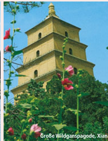
Große Wildganspagode, Xian