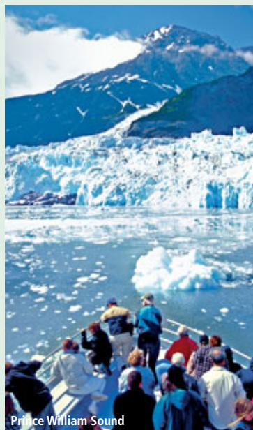
Prince William Sound