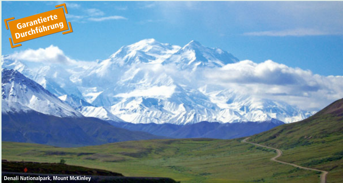
Denali Nationalpark, Mount McKinley