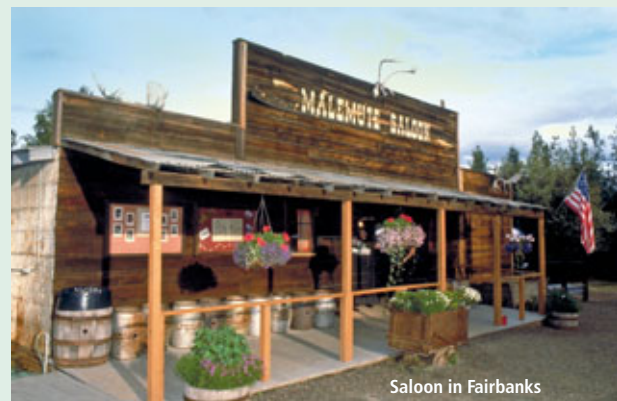
Saloon in Fairbanks

Sehen Sie einige der spektakulärsten Landschaften und Nationalparks, die Alaska und der Yukon zu bieten haben. Sie folgen den Spuren der alten Goldgräber und Abenteurer. Hier im hohen Norden erleben Sie eine gewaltige Natur mit Gletschern und imposanten Bergmassiven. Bewundern Sie die vielfältige Tierwelt im Land der Mitternachtssonne und der Nordlichter.