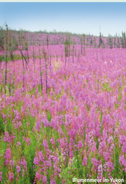
Blumenmeer im Yukon