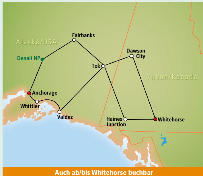
Auch ab/bis Whitehorse buchbar